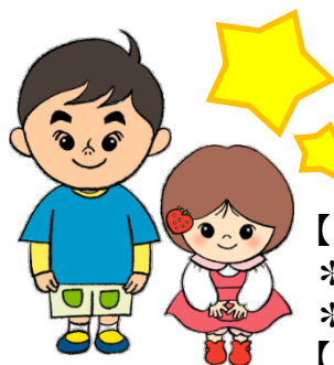
イラスト制作 橋本さと子

(先行研究9.5%) Matsuishi et al. Brain & Development 2008;30:410-415