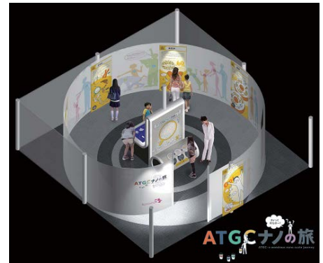
展示コーナー全体イメージ

※ ATGC とは・・・二重らせん構造であるDNAを構成する4種類の塩基の頭文字。この4文字の配列が生物の体をつくる「レシピ」となる。