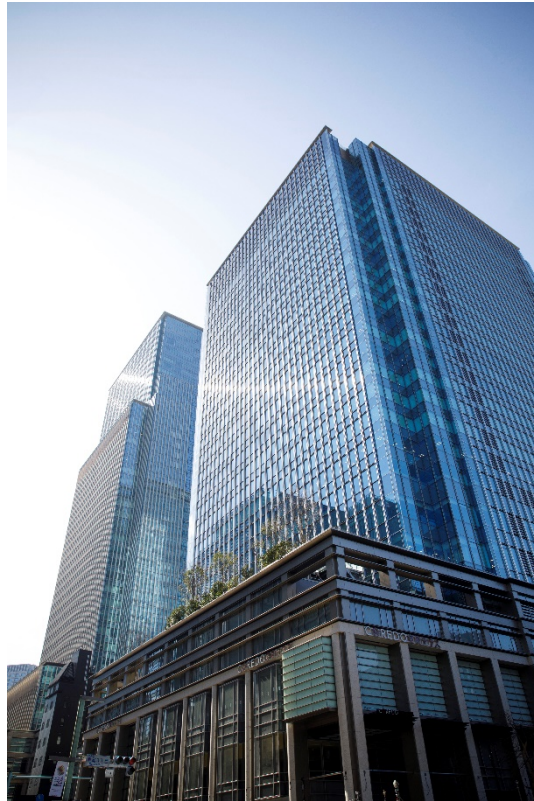
日本橋共用端末室のある日本橋室町三井タワー

(2)ゲノム解析情報へのアクセス方法の利便性向上(インターネット型) より利便性を向上して各地の研究者に利活用いただくため、スーパーコンピュータに新たな区画として Unit G を新設し、性別、年齢のみを付随したゲノム解析情報についてインターネット上から参照可能としました。これまでゲノム解析情報については、遠隔セキュリティエリアからのみアクセス可能でしたが、本ユニットの新設によりこれらの情報をインターネット接続があれば自席から利用可能になります。 対象となるデータは約 5,000 人の個人ごとの遺伝型データ、約 3,500 人のインプューションパネル、およびこれらのデータに付随する性別、年齢であり、情報分譲の申請・承認の手続きを経たうえでご利用が可能となります。基本的にデータは参照のみで、解析結果である個人特定性のない統計情報に限り持ち出し可能です。なお、 Unit G を利用するためには、試料・情報分譲と同様、研究計画の審査や公示、契約の締結等の手続きが必要となります。