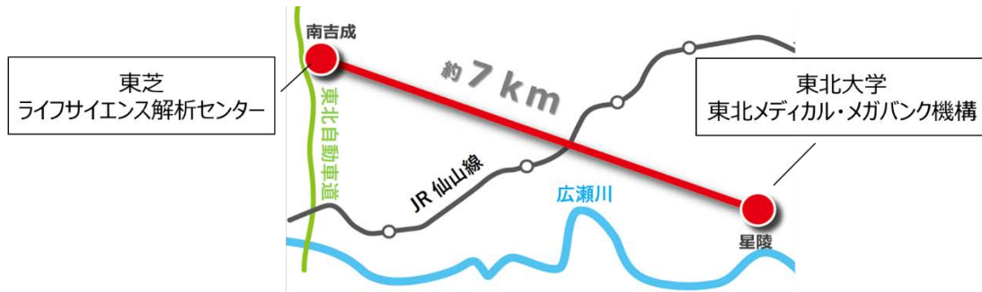
図 2 伝送拠点と伝送経路の概要