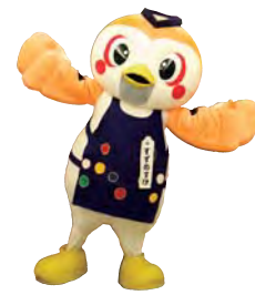
仙台・青葉まつりマスコットキャラクター 青葉すずのすけ