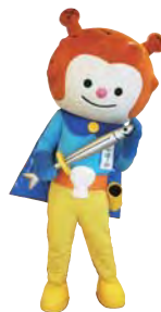
気仙沼市観光キャラクター 海の子ホヤぼーや