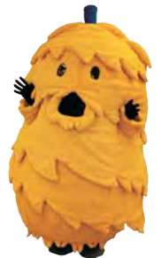
栗原市マスコットキャラクター なじりほんによ