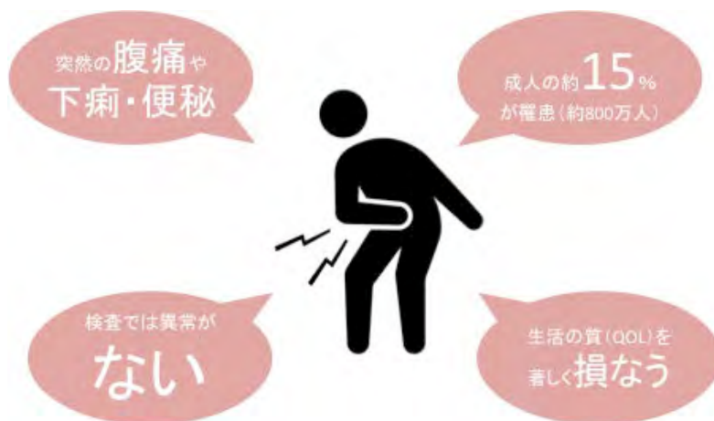
図 1.過敏性腸症候群